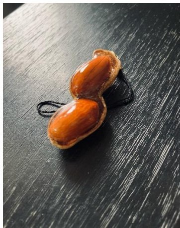
大村市 牧場まつり 抽選景品 「落花生ストラップ」