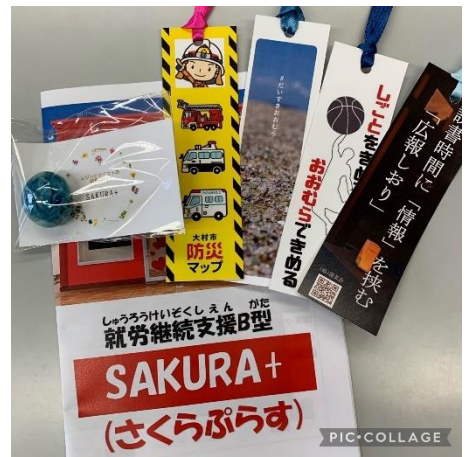
QRコード付き 広報しおり 安全対策課・商工振興課 ほか