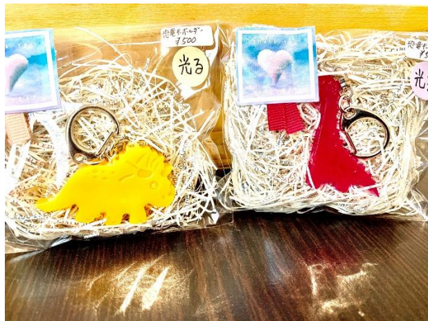
大村市 健康福祉まつり スタンプラリー景品 「光る!恐竜ストラップ」(国保けんこう課)