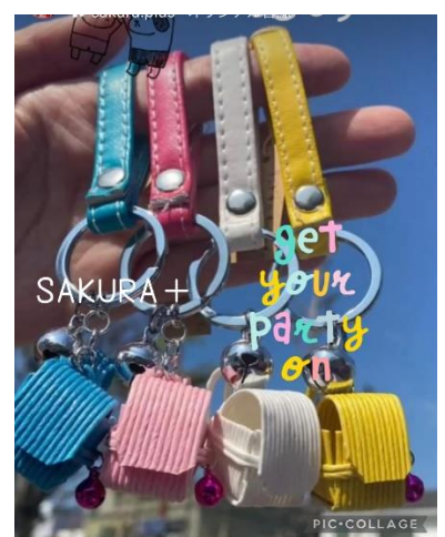
交通安全おまもり 「ランドセルキーホルダー」