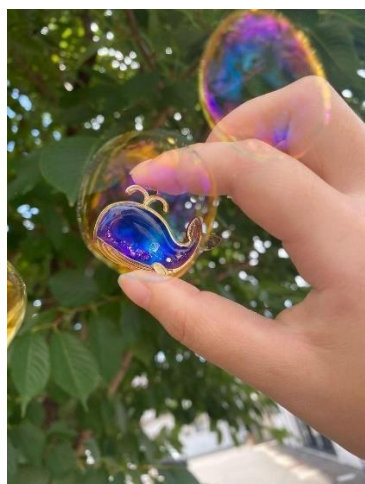
大村市 牧場まつり 抽選景品 「くじらのキーホルダー」