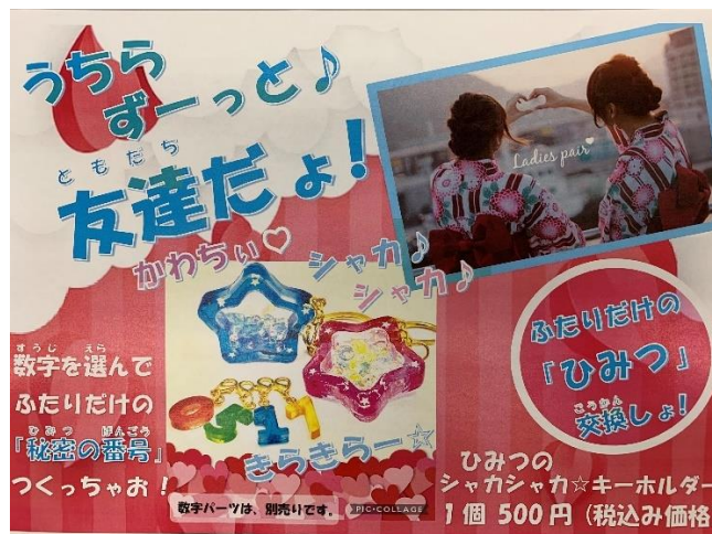
大村城南高校 文化祭 「シャカシャカ☆キーホルダー」